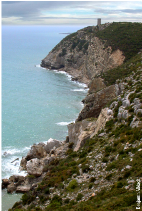
Sierra de Irtá, Torre Abadum

entidad promotora: Ayuntamiento de Peñíscola